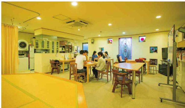
北山通ソウクリニック デイケアルーム

このデイケアで、特に気をつけて実践しているのは、「つまずきを減らして心の安定を図ること」。「つまずき」とは、患者さんが「できない」「わからない」という事態に直面して、不安、落ち込みを感じることを指します。そんな「つまずき」を減らし、心の安定を取り戻して初めて、「意欲・想い・笑顔を引き出す」ことができる。さらに、その結果として「言葉と笑顔が増え、心が元気になる」と考えて患者さんと向き合っています。