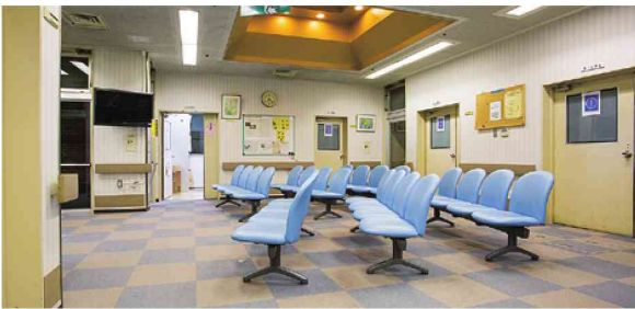
京都府立洛南病院 待ち合い

「10のアイメッセージ」が叶えられた2018年3月の京都、それが私たちが「たどりつきたい地平」であり、私たちのミッションです。