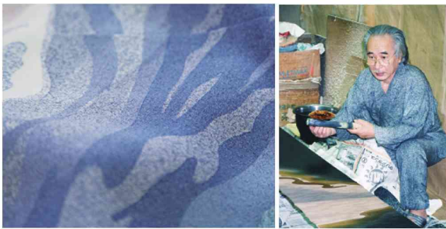
元気なころの父はじっとしていられない人でした。遊びも付き合ひも広い人で、数えきれない程の趣味がありました。きっとそれは、父の仕事であるろうけつ染めの図案のネタ探しという一面もあったのでしょうけど、一番はきつとさみしがり屋だったんだと思います。父は音気質の職人だったので、同じこと二度聞いたら怒鳴る、三回聞いたら物が飛ぶというような人でしたので、私は友禅染めとろうけつ染めを父の工房で長く勤めておられた職人さんから習いました。でも、職場も家の中もあんまり変わらなかったですね。(笑)

その大切な父と、大切な時間を、精一杯過ごすことができ、本当に感謝の気持ちでいっぱいです。