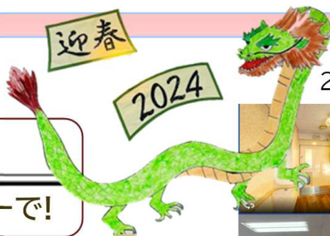
2F 利用者様作品 2024 迎春

これからもしずはうすの魅力の発信を手伝えたらなと思っておりますので、宜しくお願い致します。